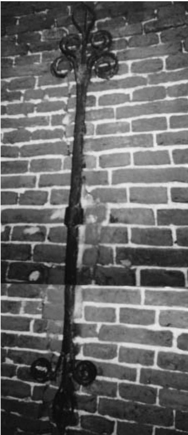
Muuranker op de boerderij 't Huijs te Vroech Op.