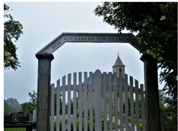
Ingang kerkhof van Stroe

De "Jacobsschelp," symbool voor de wandelroute naar Santiago de Compostella en voor de bedevaartgangers is er een stempel iom in hun paspoort te stempelen!