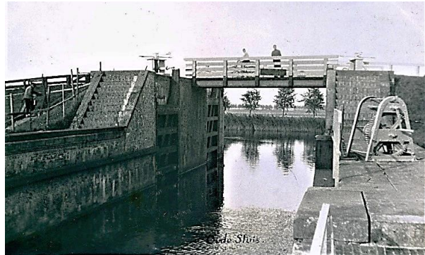
De sluis van Oudesluis

Bij de rotonde gaan we la. de brug over van het Oude Veer en dan meteen ra. de Kneeskade op. We passeren molen Leonide, die in 2002 als luxe woonhuis is gebouwd. Aan het eind van de Kneeskade gaan we la. de Noorderweg op, maar eerst even naar rechts om te genieten van de oude sluis: Ooit een van de grootste van Europa!