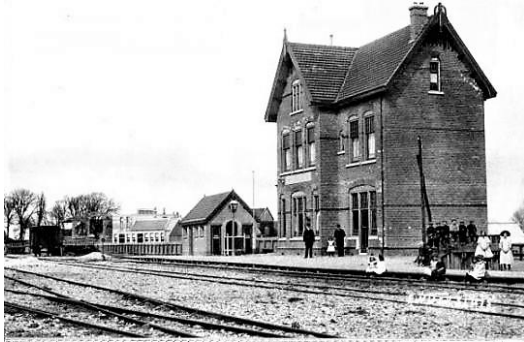
Station Van Ewijcksluis

We rijden dan door langs de buitenkant van het Amstelmeer naar Van Ewijcksluis via de Haukessluisweg, Amstelmeerweg, de Oosthoekweg en dan ra. over de Amsteldijk naar de Sluisweg, waarover we Van Ewijcksluis binnen rijden.