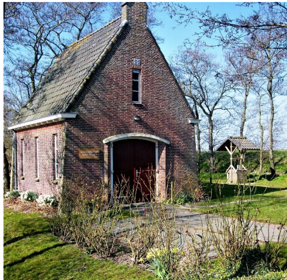
Kapel van de Keins