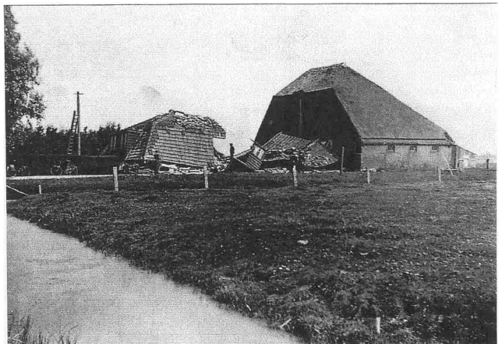
Boerderij van G. W. Waiboer te Sint Maartensbrug na de bominslag op 3 september 1940.

Bij de kruising met de Schagerweg over de brug r.a. en recht door terug naar het Zijper Museum,;