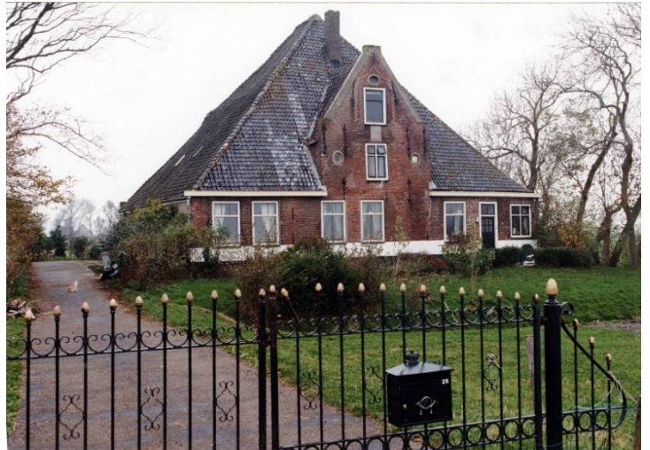
Huijs te Vroech Op