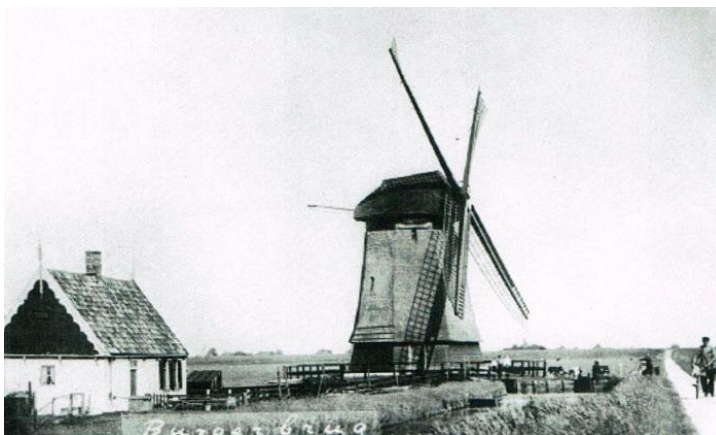
Molen A met molenhuis