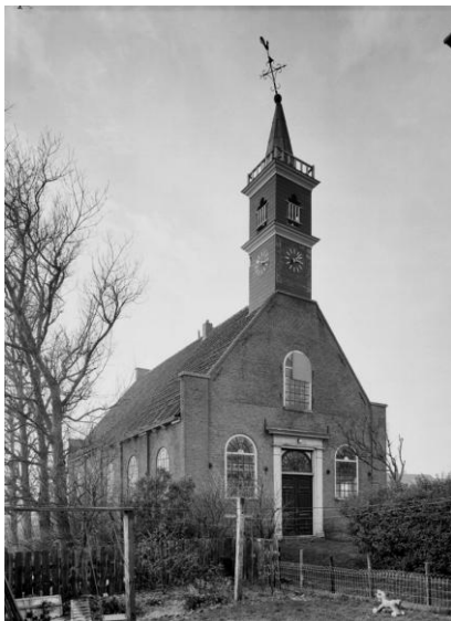
Hervormde kerk ca. 1970

Even verderop staat de Hervormde Kerk, gebouwd in 1850. De kerk is een z.g. ‘Waterstaatskerk’ vanwege de opdracht van koning Willem I aan de minister van o.m. Waterstaat, voor de bouw van nieuwe kerken.