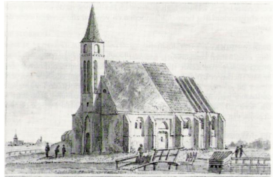
1 e kerkje van Eeningeburg

Wij lopen verder over de oude Westfriesse Omringdijk, 126 km lang, die al sinds 1250 een aaneengesloten verzameling van dijken en dijkjes vormt en is opgebouwd door de bewoners in hun eeuwige strijd tegen het water!