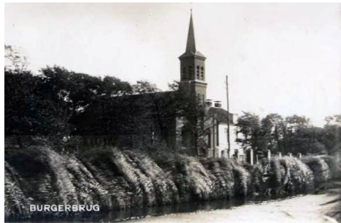
Rooms Katholieke kerk in 1950

Daarna konden er nieuwe kerken worden gebouwd met Koninklijke goedkeuring! De kerk in Burgerbrug is gerestaureerd en nu in beheer bij de stichting “De Herboren Toren.”